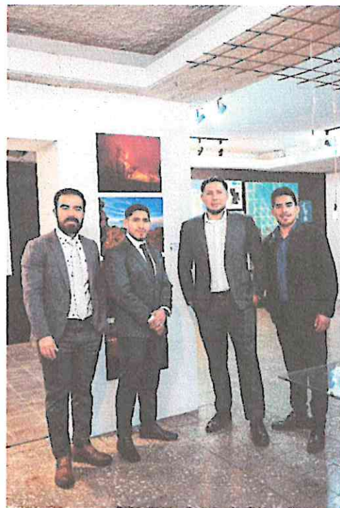
Con mis invitados pasamos una velada buena en la inauguración de la exposición.