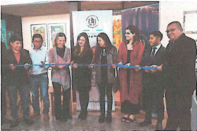
Todos los artistas junto con directora de CREA cortando la cinta simbólica.