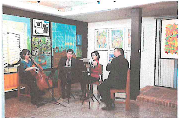
El Cuarteto del Alba interpretando sus mejores piezas.